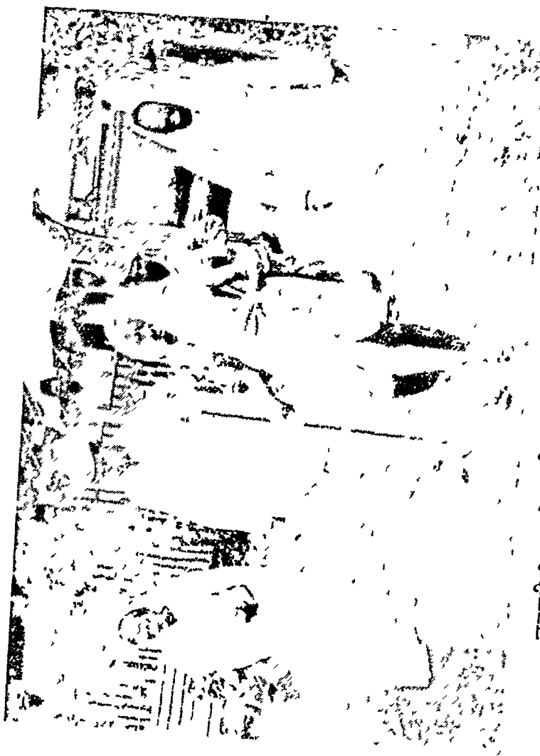
जनवरी १९४२ में वर्धा कार्य कारिणी की बैठक